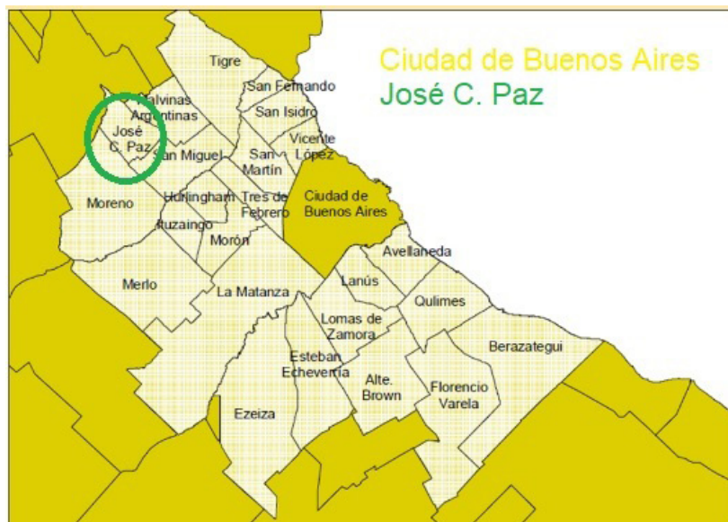
Figura 1: Localización de José C. Paz