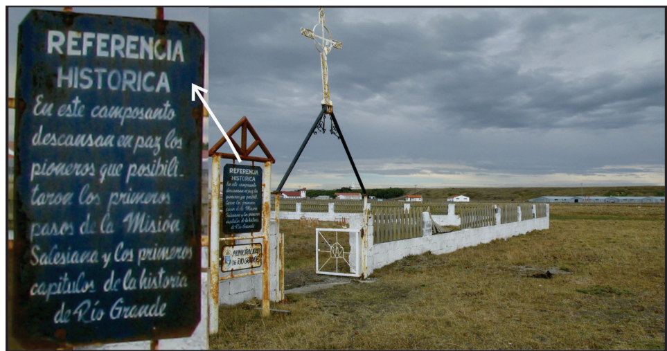
Figura 2. Entrada del cementerio de la Misión.

La puesta en valor del cementerio según esta iniciativa aún no ha sido aplicada, con lo cual este trabajo no presentará resultados en términos de valoraciones de los distintos grupos de interés. En estos momentos, lo que se está llevando a cabo junto a la comunidad selknam es el regreso a la provincia de Tierra del Fuego de los restos que fueron exhumados del cementerio de la Misión, y el acompañamiento en su posterior restitución a la comunidad. Esto constituye ahora el principal interés por parte de la comunidad: lograr la restitución y llevar a cabo la depositación final de los restos. La puesta en valor del cementerio aún no es parte de su agenda, por ello no se ha comenzado a trabajar en dicha etapa.